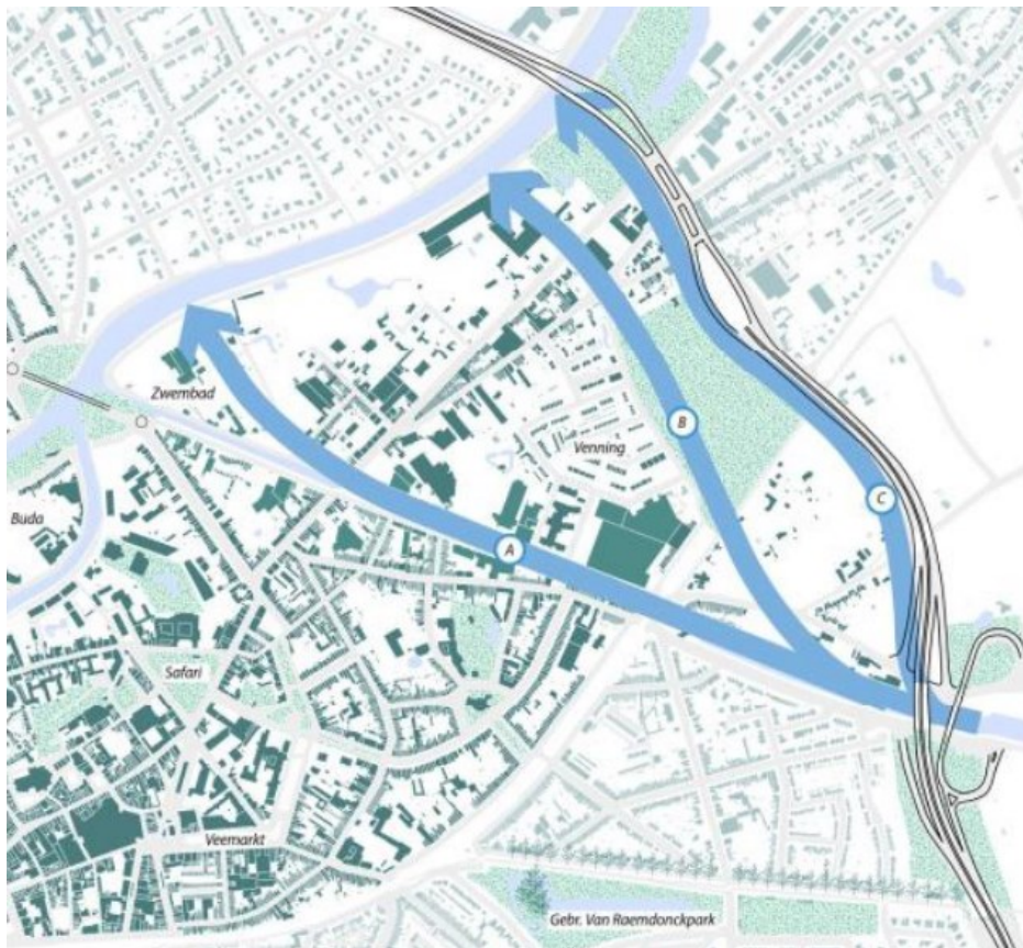
Figuur 1 Conceptuele weergave van de drie tracéalternatieven

In het zuidelijk kanaalsegment Boven-Schelde – La Flandrebrug wordt geen verbreding vooropgesteld, maar geeft men aan in de toekomst het kanaal te verdiepen met mogelijk effecten op de waterhuishouding tot gevolg.