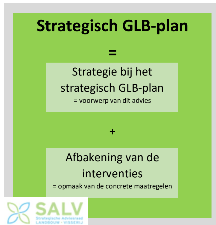
Figuur 1. Voorbereiding van het strategisch GLB-plan. Het voorwerp van onderhavig advies is de strategie bij het strategisch GLB-plan

De ambtelijke voorbereiding van het GLB-plan in Vlaanderen werd reeds in 2017 gestart met een omgevingsanalyse en de opmaak van een SWOT als halfwegeevaluatie van het programma voor plattelandontwikkeling PDPOIII. Na bekendmaking van de mededeling van de Commissie 'De toekomst van voeding en landbouw' en haar intentie om de lidstaten in beide pijlers van het landbouwbeleid meer beleidsruimte toe te kennen, werd de pijler II-evaluatie opgeschaald tot het gehele landbouwbeleid. Zo werden er vanuit het Vlaams Ruraal Netwerk twee publieke bevestigingen georganiseerd in februari 2018. Deze bevestigingen verrijkten de SWOT, die als basis werd gehanteerd om een nodenanalyse op te maken. De nodenanalyse werd op geregelde tijdstippen afgetoetst bij de voornaamste stakeholders binnen een klankbordgroep. De SWOT is via zijn opname in het LARA'18 publiek kenbaar gemaakt, terwijl de nodenanalyse niet formeel en publiek is bestendigd. Op basis van SWOT, nodenanalyse en overige studies, plannen, en visiedocumenten heeft het departement Landbouw en Visserij een ontwerpstrategienota bij het strategisch GLB-plan voorbereid. Deze ontwerpstrategie maakt het voorwerp van voorliggend advies uit (zie figuur 1).